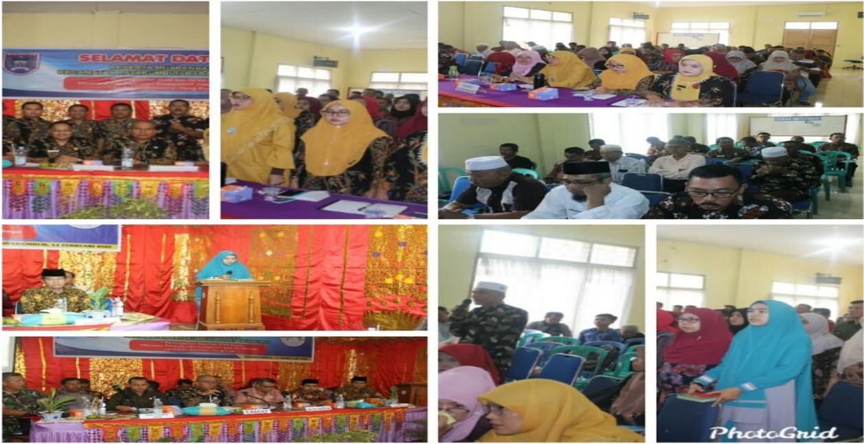
Gambar Kegiatan Goro dan PKK dan Dasawisma