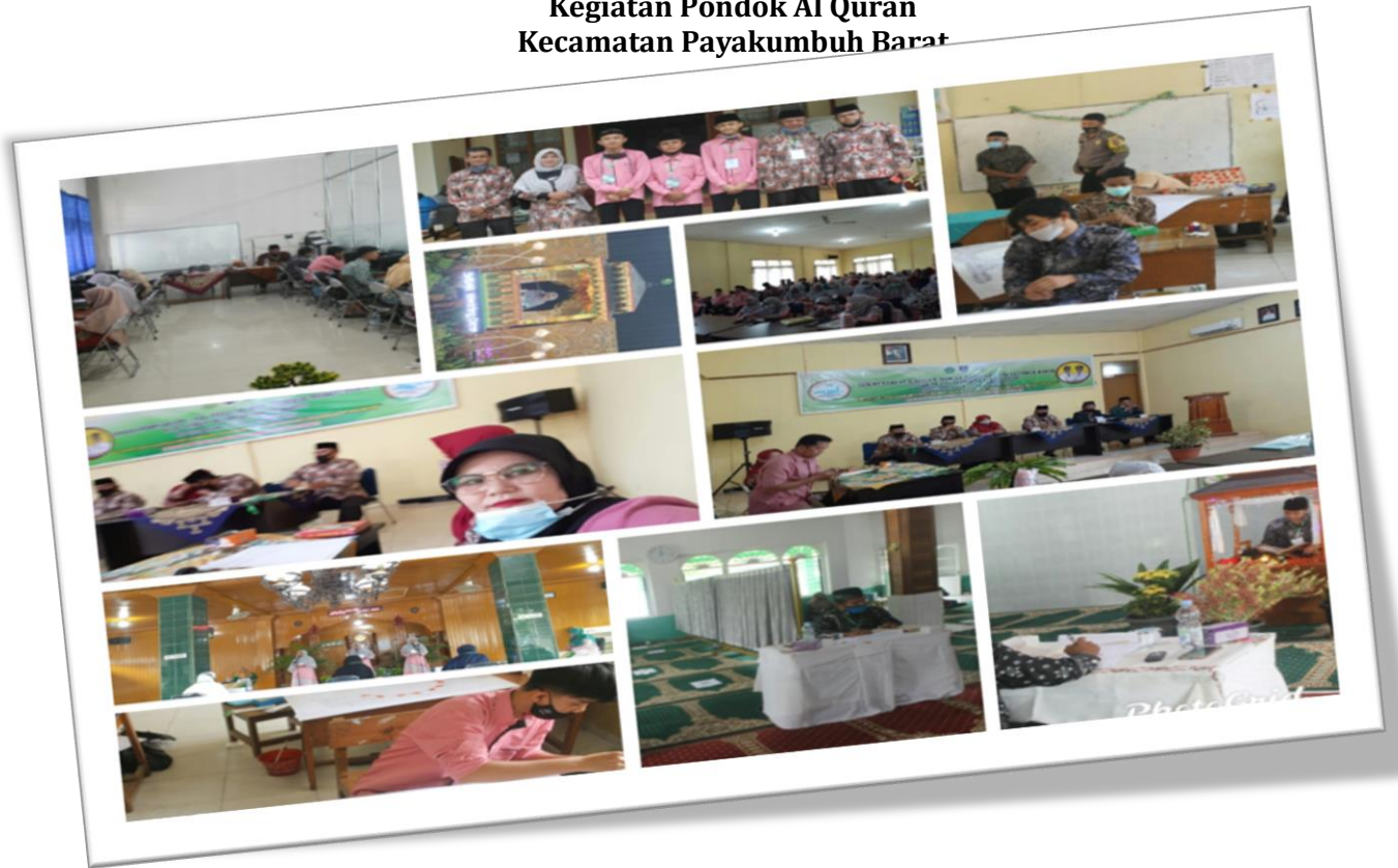
Gambar 3 Kegiatan Pondok Al Quran Kecamatan Payakumbuh Barat