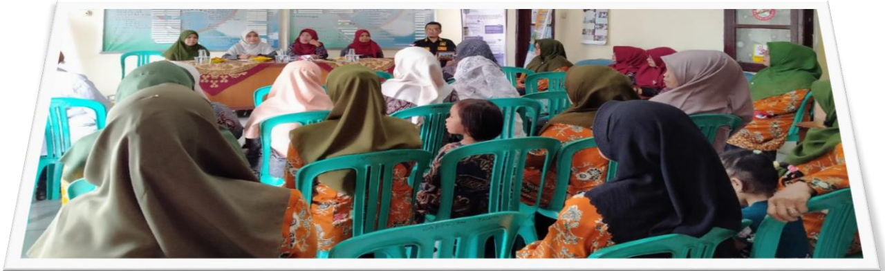
Gambar Kegiatan Lembaga Kemasyarakatan Aktif dalam Kegiatan Musrenbang Kelurahan dan Kecamatan