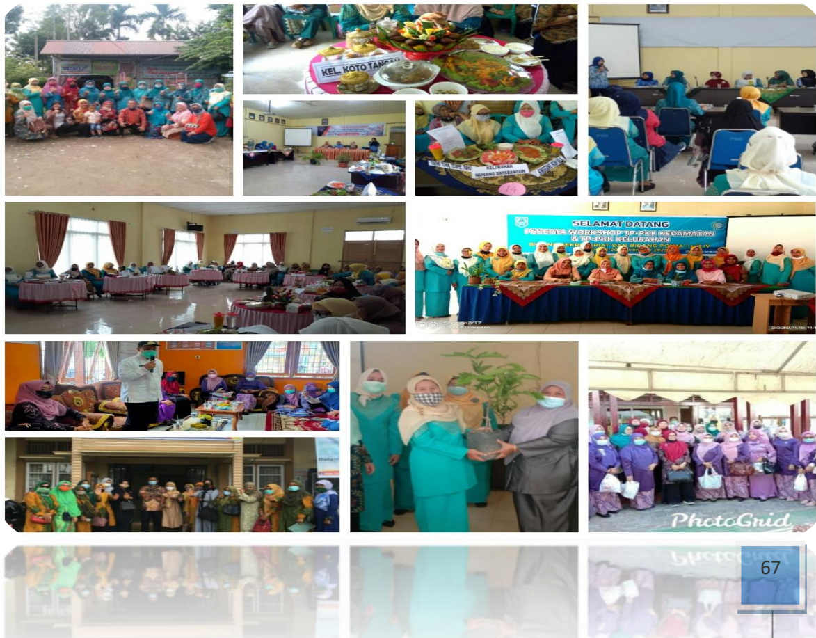
Gambar Kegiatan Lembaga Kemasyarakatan Aktif