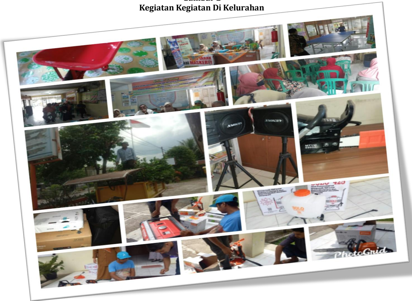
Gambar 2 Kegiatan Kegiatan Di Kelurahan

Selain itu, program lain yang mendukung Capaian kinerja sasaran meningkatnya Kualitas pelayanan publik adalah program Penyelenggaraan Urusan Pemerintahan Umum sesuai Penugasan Kepala Daerah dengan kegiatan Peningkatan Pelaksanaan semua urusan Pemerintahan yang bukan merupakan Kewenangan Daerah dan tidak dilaksanakan oleh Instansi Vertikal. Program ini merupakan salah satu upaya kami untuk memberikan pelayanan dan kemudahan bagi masyarakat dalam melaksanakan ajaran agama agama islam. Kegiatan ini dilaksanakan berupa kegiatan pondok quran yang dilaksanakan secara rutin 1x dalam seminggu. Dengan adanya kegiatan pondok Qur'an ini diharapkan dapat menciptakan generasi qurani dan berakhlak mulia. Tujuan dari kegiatan ini juga sebagai wadah dalam mempersiapkan kafilah-kafilah yang akan dikirim dalam lomba MTQ tingkat Kota sebagai perwakilan dari Kecamatan Payakumbuh Barat.