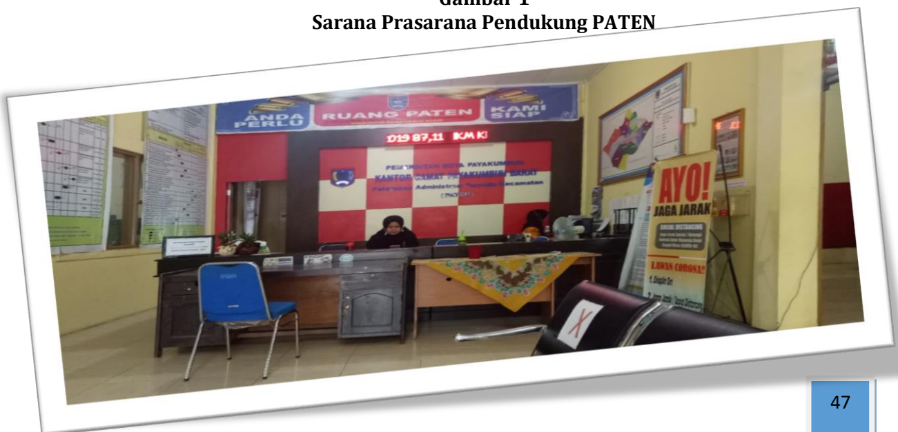
Gambar 1 Sarana Prasarana Pendukung PATEN

Pelaksanaan Pelayanan Publik melalui Inovasi TENTARA MENANTI – Paten Antar Alamat Melayani Dengan Hati , diberikan kepada Masyarakat dengan jenis Pelayanan yang penandatangannya tidak bisa diwakilkan dan mengharuskan Camat yang menandatangani surat tersebut, seperti Surat Tanah, Susunan Keluarga, Dispensasi Nikah dan Surat Keterangan lainnya . Jika Camat tidak ditempat berkas tersebut ditinggal pada petugas dengan meninggalkan Nomor Kontak yang bisa dihubungi. Berkas akan ditindaklanjuti dengan cara mengantarkan Surat ke alamat yang bersangkutan atau menghubungi melalui telepon jika sudah ditandatangani Camat.