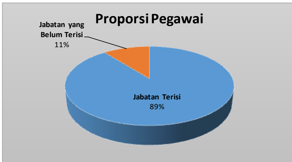
Tabel 1.4 Data Pegawai Kelurahan